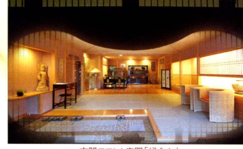
玄関フロント広間「縁えん」