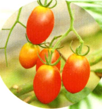
アルカリ源泉による自家栽培の野菜

飲泉・自家源泉かけ流し ひょうたん風呂・乙女風呂の大浴場 全15室 離れ産土亭 Ubusunatei