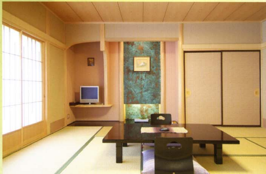
飲泉・自家源泉かけ流し 檜風呂付きのお部屋