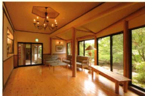
檜の香りが漂うロビー