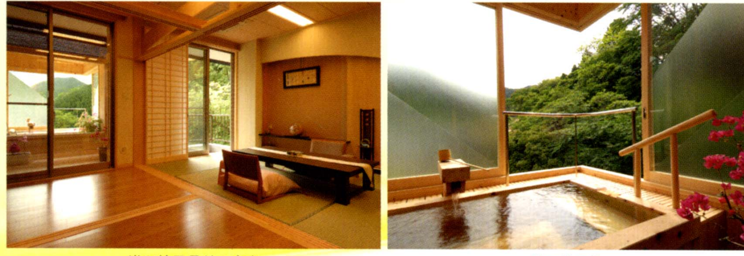
満天檜風呂付の客室