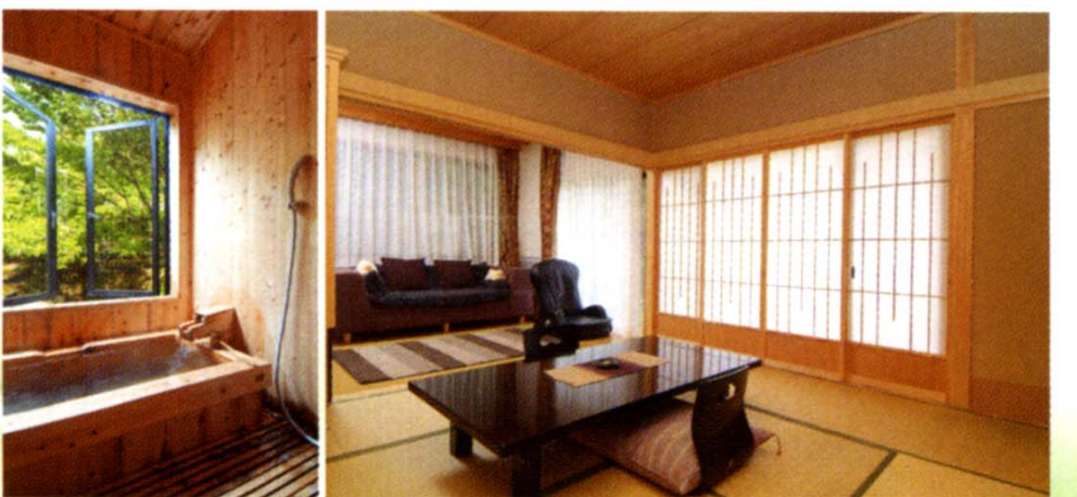
飲泉・自家源泉かけ流し 檜風呂付のお部屋