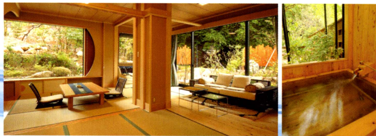
庭園檜風呂付のお部屋 Aタイプ

精神修業の場として誕生した「正運館」。 その名は、創業者に由来します。 そして今、飲泉・自家源泉かけ流し 庭園檜風呂付のお部屋に生まれ変わりました。