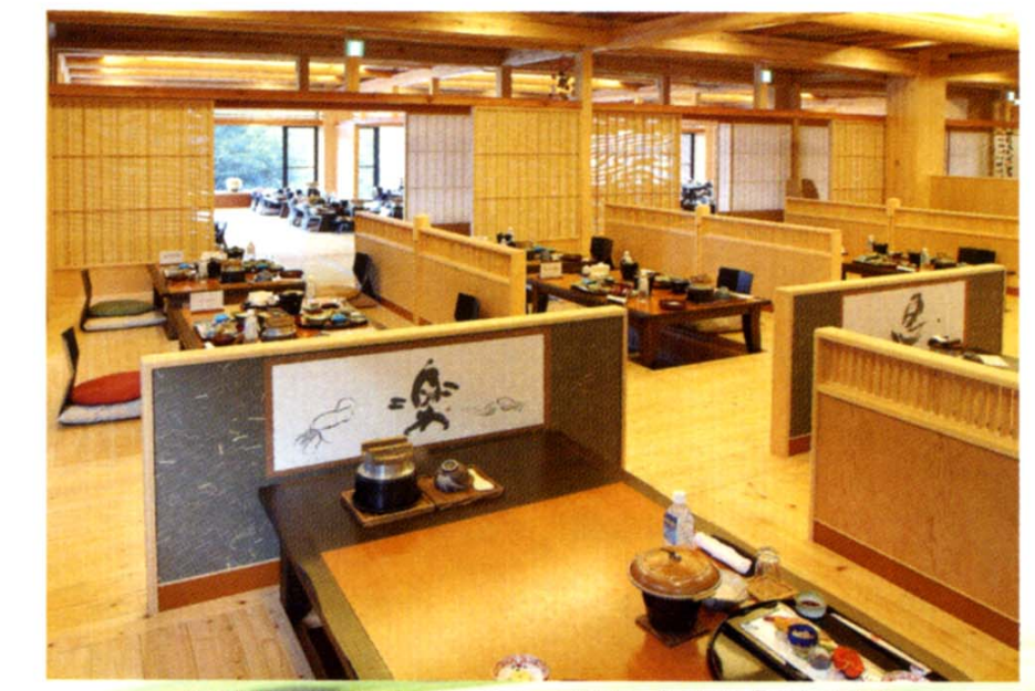
天然檜(敷地内のもの)が薫る食事処「四季彩」

伊豆奥下田の山海の旬味を檜の薫るお食事処で どうぞ... 洗う、煮る、蒸す、焼く、炊くのすべて の調理に観音源泉水が使われています。