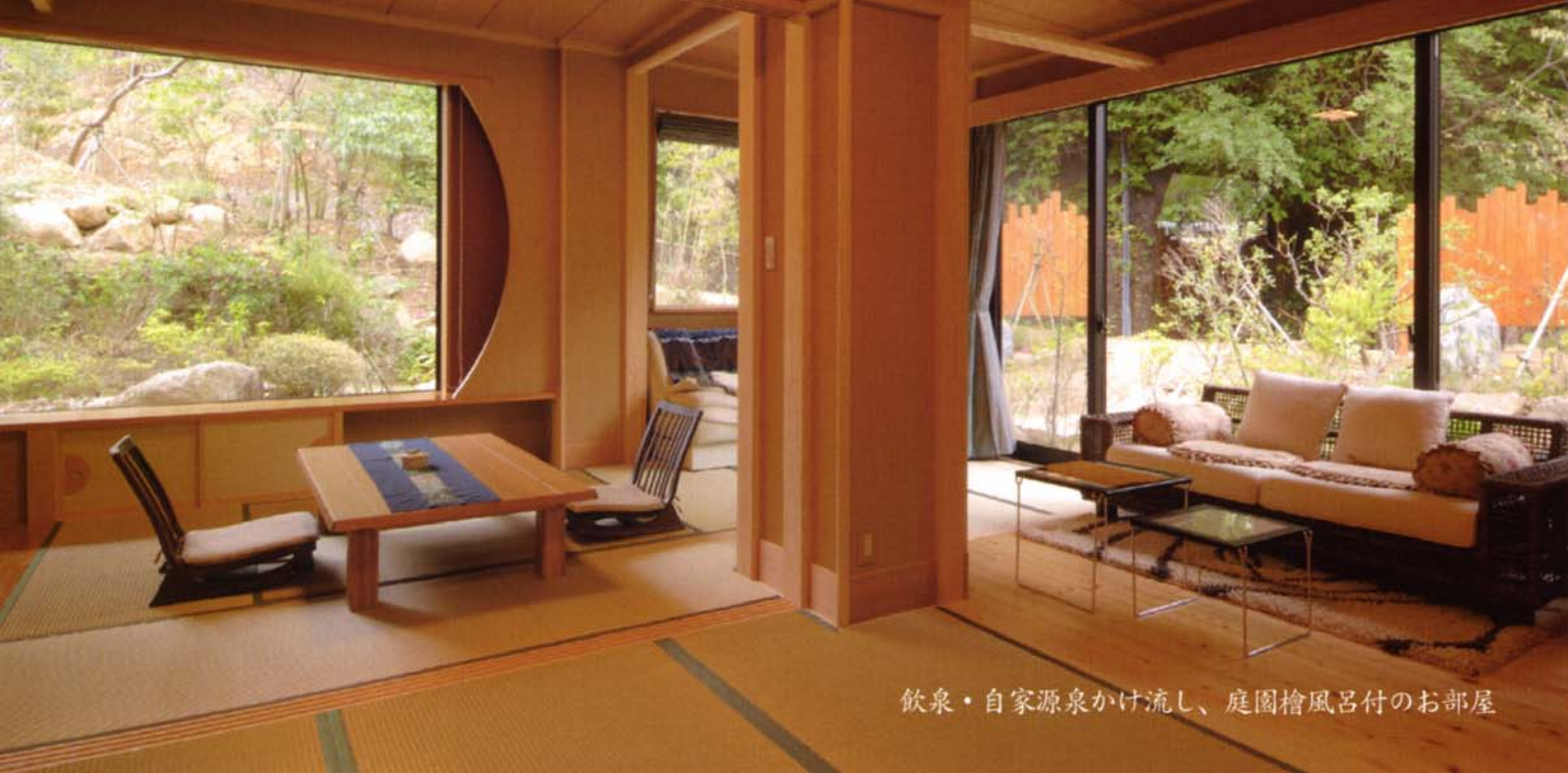
飲泉・自家源泉かけ流し、庭園檜風呂付のお部屋

飲泉・自家源泉かけ流し、檜風呂のビロード浴と開放的な庭園森林浴…。 静かに流れるやさしい時間。