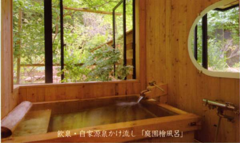
飲泉・自家源泉かけ流し「庭園檜風呂」