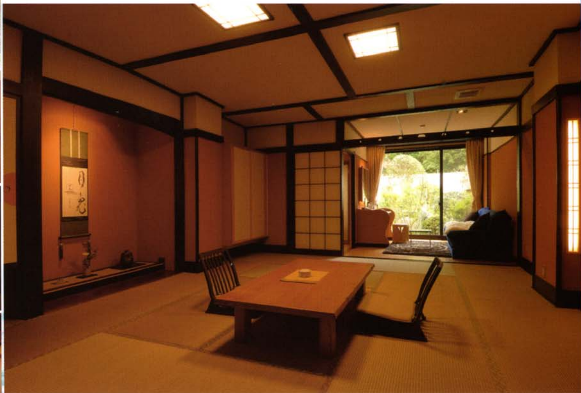
飲泉・自家源泉かけ流し 庭園檜風呂のお部屋