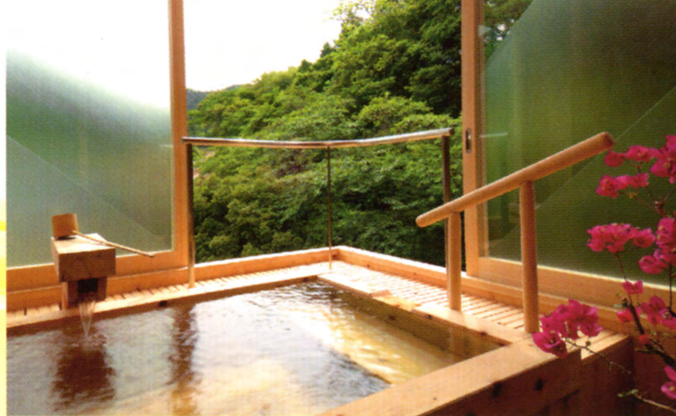
飲泉・自家源泉かけ流し「満天檜風呂」