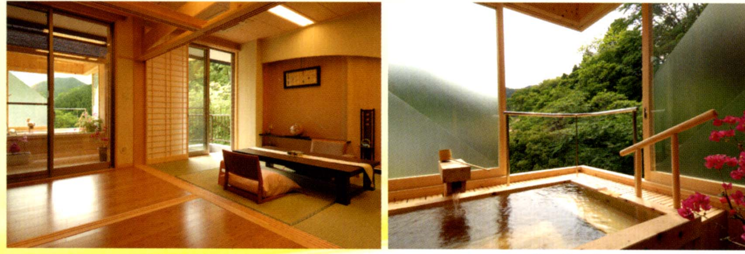
満天檜風呂付の客室