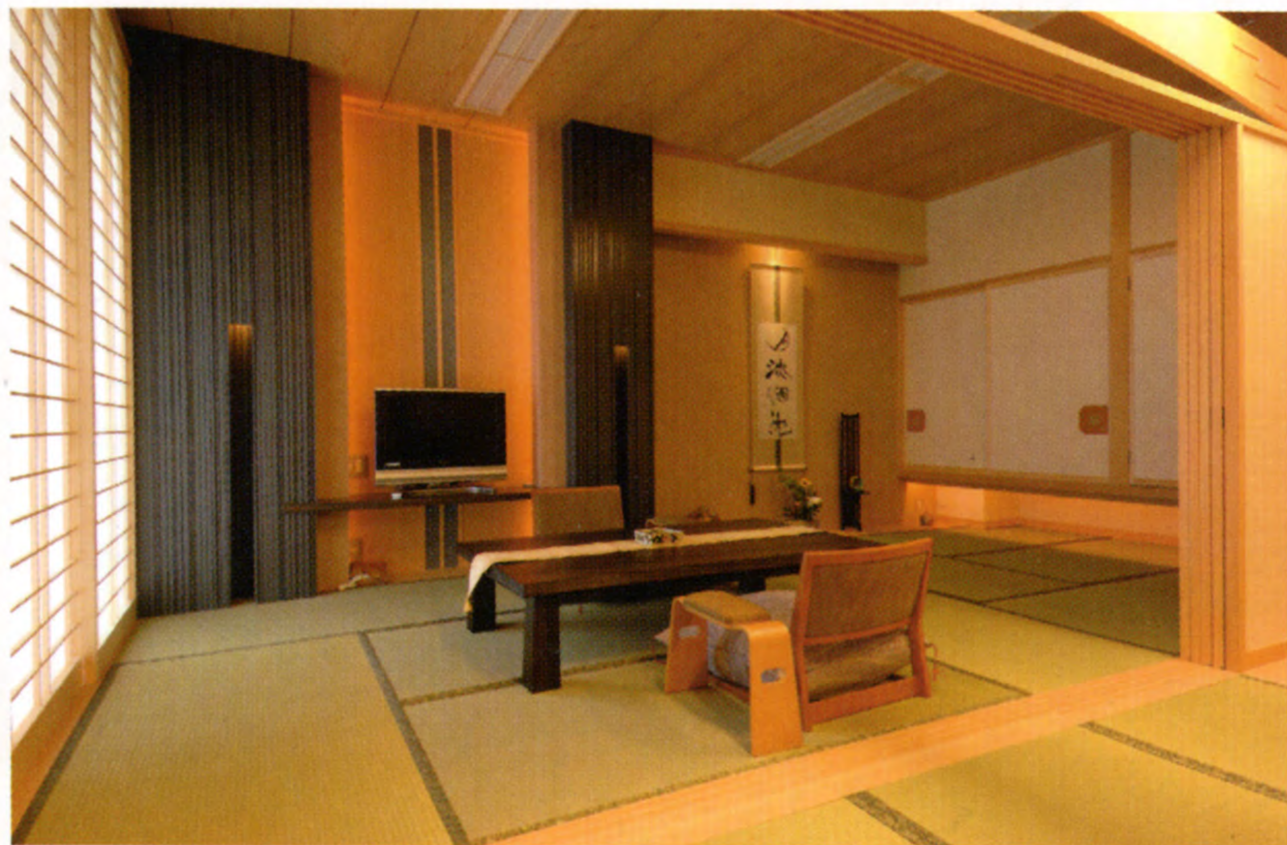
飲泉・自家源泉かけ流し「満天檜風呂」の一般客室（和室タイプ）