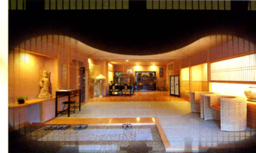
玄関フロント広間「縁えん」