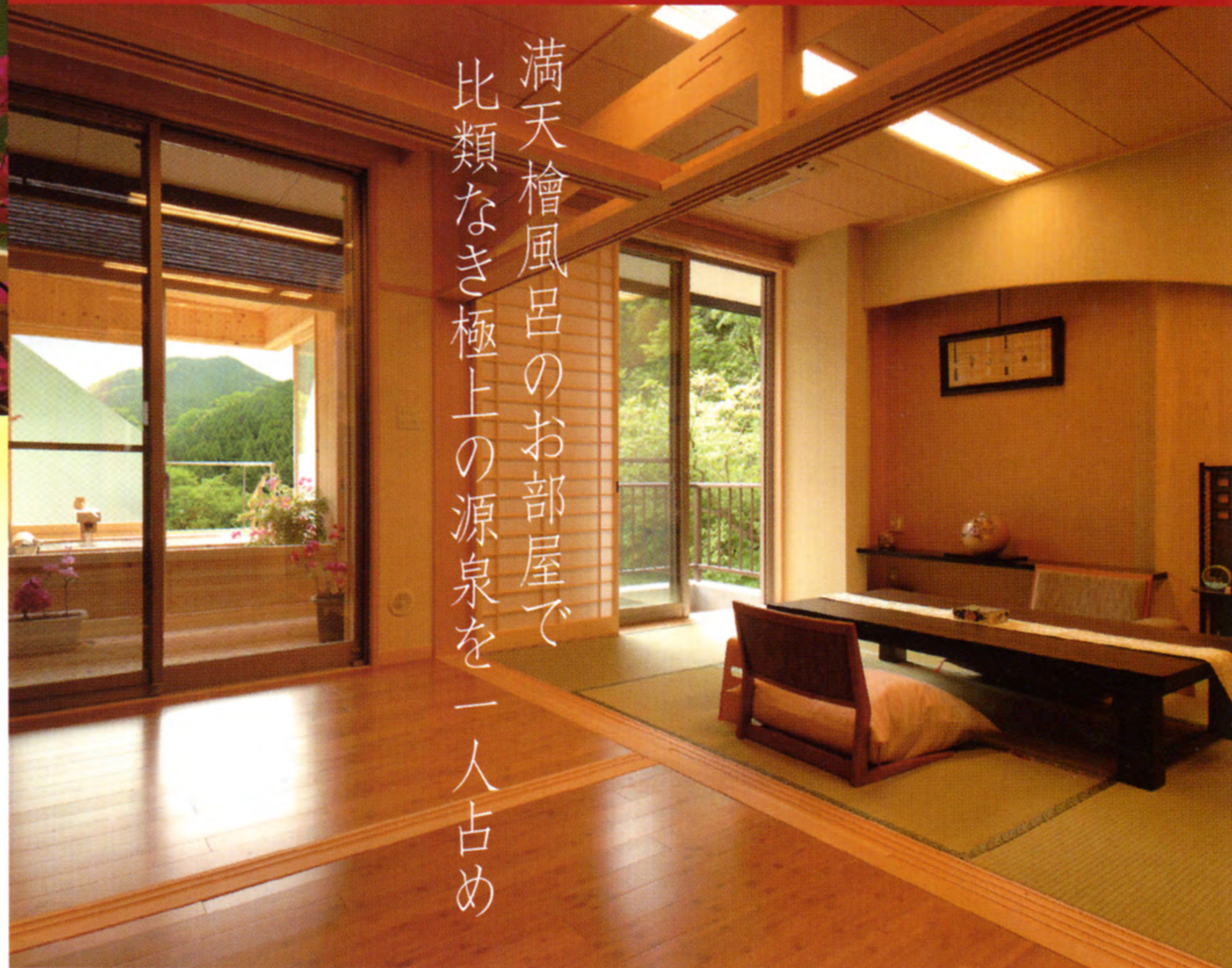
飲泉・自家源泉かけ流し「満天檜風呂」の一般客室（フローリングタイプ）