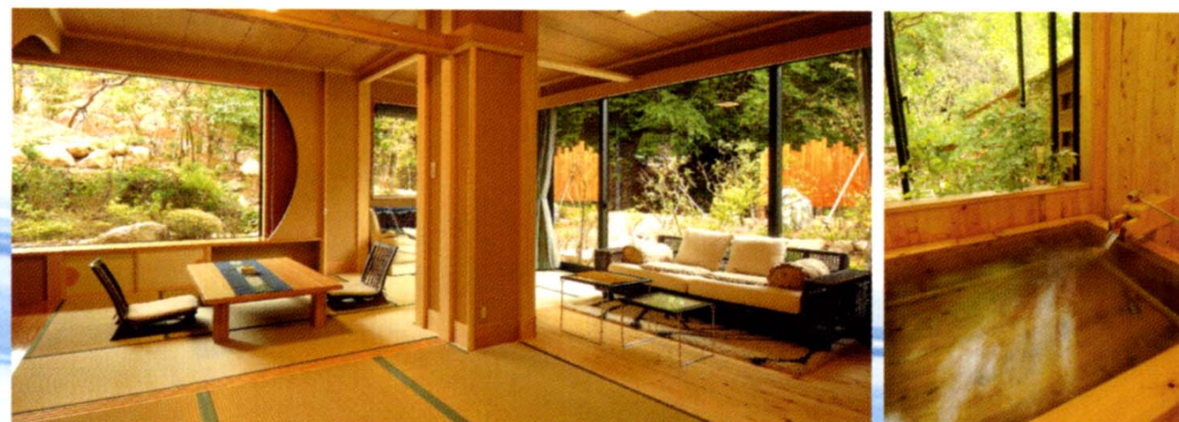
庭園檜風呂付のお部屋 Aタイプ

精神修業の場として誕生した「正運館」。 その名は、創業者に由来します。 そして今、飲泉・自家源泉かけ流し 庭園檜風呂付のお部屋に生まれ変わりました。